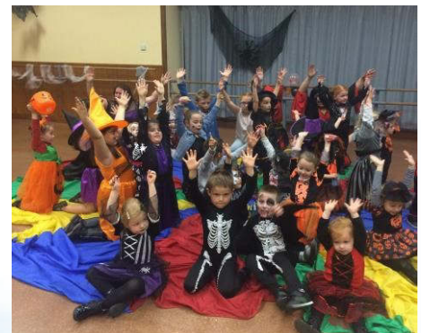
Boum d'Halloween le 19 octobre 2018.