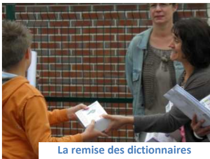
La remise des dictionnaires