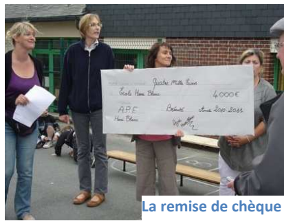
La remise de chèque

Suite à cette belle cérémonie, une grande kermesse a pris place dans les cours de l'école. Une dizaine de stands, des gros lots, une buvette garnie de délicieuses pâtisseries ont fait le bonheur de tous !