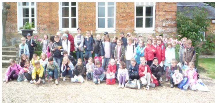
Les classes de CP-CE1 et CE1-CE2 au château de Bois-Guilbert le 10 juin 2011

Comme tous les ans, en 2012, l'APEL subventionnera une partie des voyages de fin d'année et en particulier le voyage en Auvergne des classes de CM1 et CM2 qui aura lieu du 2 au 6 avril. Nous participerons également aux dépenses occasionnées par le projet de construction qui débutera courant novembre pour une durée d'un an. En effet, suite à l'obtention du permis de construire, l'Association Immobilière de la Région Normande va entreprendre des travaux qui consisteront à construire un nouveau bâtiment pour remplacer les classes de maternelle existantes ainsi que le bâtiment modulaire.