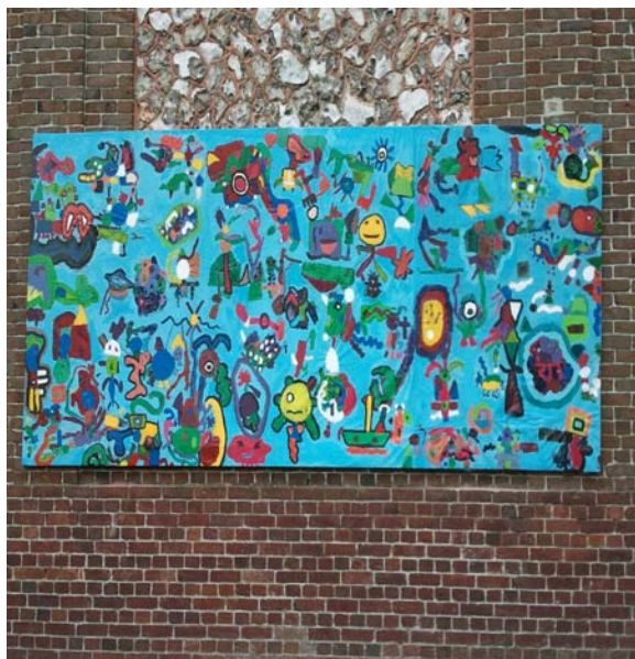
Fresque réalisée par les élèves de la classe de CE1-CE2

Ce projet pédagogique sur « l'Art au XXème siècle » débuté après les vacances de février, a enthousiasmé les élèves et l'ensemble de la communauté éducative. Il s'est clôturé le 25 juin par une exposition regroupant les œuvres réalisées par les enfants de la maternelle au CM2. Les membres de l'APEL étaient présents pour offrir aux familles le verre de l'amitié.