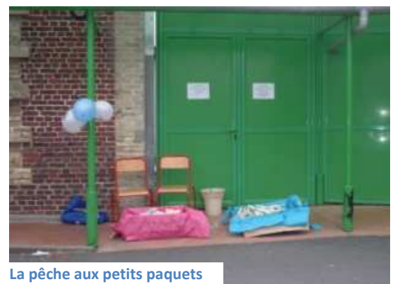
La pêche aux petits paquets