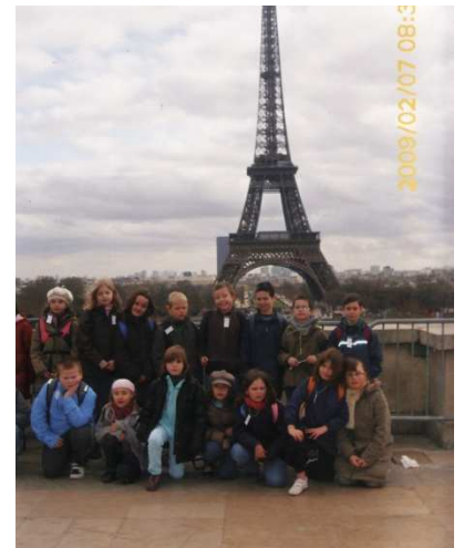
Le voyage à Paris !