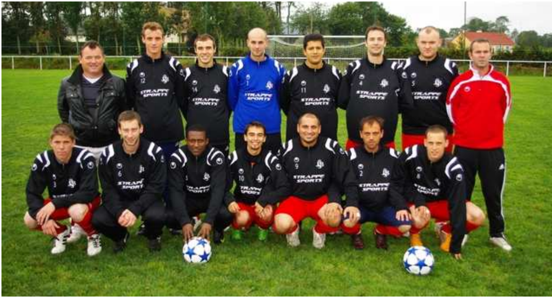
Équipe fanion de la JSB évoluant en 2 ème division de district