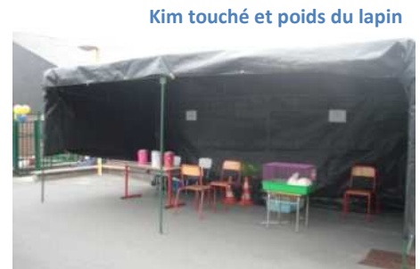
Kim touché et poids du lapin