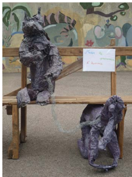
Sculptures réalisées par les élèves de la classe de CM1