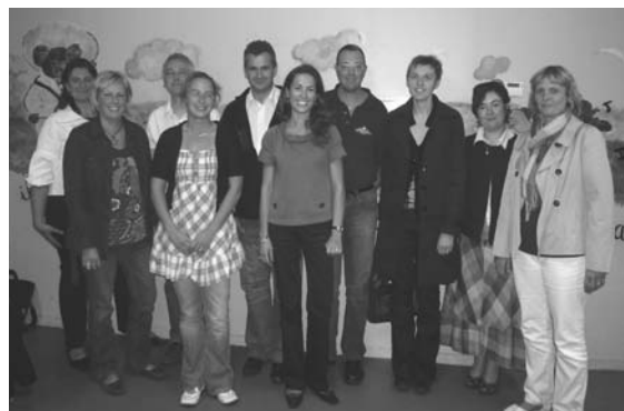
Les membres de l'A.P.E.L.