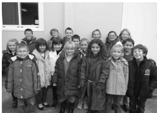
Les élèves de CE2 devant leur nouvelle classe